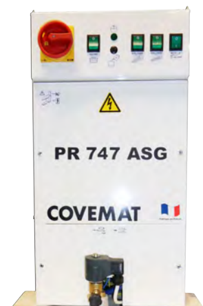
Coffret électrique centralisé